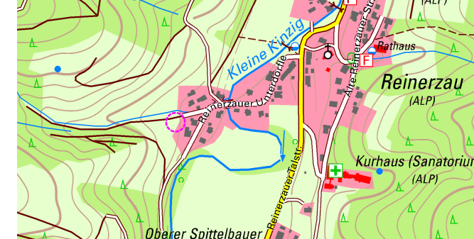
Lage im Raum

Aufstellungsbeschluss (§ 2 Abs.1 BauGB): _____ Bekanntmachung des Aufstellungsbeschlusses: _____ Beschluss zur frühzeitigen Beteiligung der Öffentlichkeit und der Behörden sowie sonstiger Träger öffentlicher Belange (§§ 3 Abs. 1, 4 Abs. 1 BauGB): _____ Bekanntmachung der frühzeitigen Beteiligung der Öffentlichkeit: _____ Frühzeitige Beteiligung der Öffentlichkeit (§ 3 Abs. 1 BauGB), frühzeitige Beteiligung der Behörden und sonstiger Träger öffentlicher Belange (§ 4 Abs. 1 BauGB): vom _____ bis _____ Abwägung der Stellungnahmen aus der frühzeitigen Beteiligung der Öffentlichkeit und der Behörden sowie sonstiger Träger öffentlicher Belange (§§ 1 Abs. 7): _____ Beschluss zur Beteiligung der Öffentlichkeit und der Behörden sowie sonstiger Träger öffentlicher Belange (§§ 3 Abs. 2, 4 Abs. 2 BauGB): _____ Bekanntmachung der Beteiligung der Öffentlichkeit: _____ Beteiligung der Öffentlichkeit (§ 3 Abs. 2 BauGB), Beteiligung der Behörden und sonstiger Träger öffentlicher Belange (§ 4 Abs. 2 BauGB): vom _____ bis _____ Abwägung der Stellungnahmen aus der Beteiligung der Öffentlichkeit und der Behörden sowie sonstiger Träger öffentlicher Belange (§§ 1 Abs. 7): _____ Satzungsbeschluss (§ 10 Abs. 1 BauGB): _____ Bekanntmachung des Satzungsbeschlusses (Inkrafttreten): _____ Anzeige § 4 GemO Landratsamt Freudenstadt: _____ Stempel / Unterschrift Ausgefertigt: Alpirsbach, den ..... Michael E. Pfaff, Bürgermeister