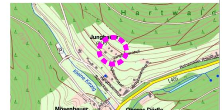
Lage im Raum