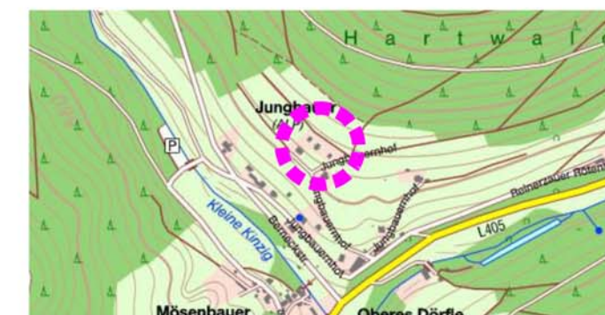
Lage im Raum

Stadt Alpirsbach Marktplatz 2 72275 Alpirsbach